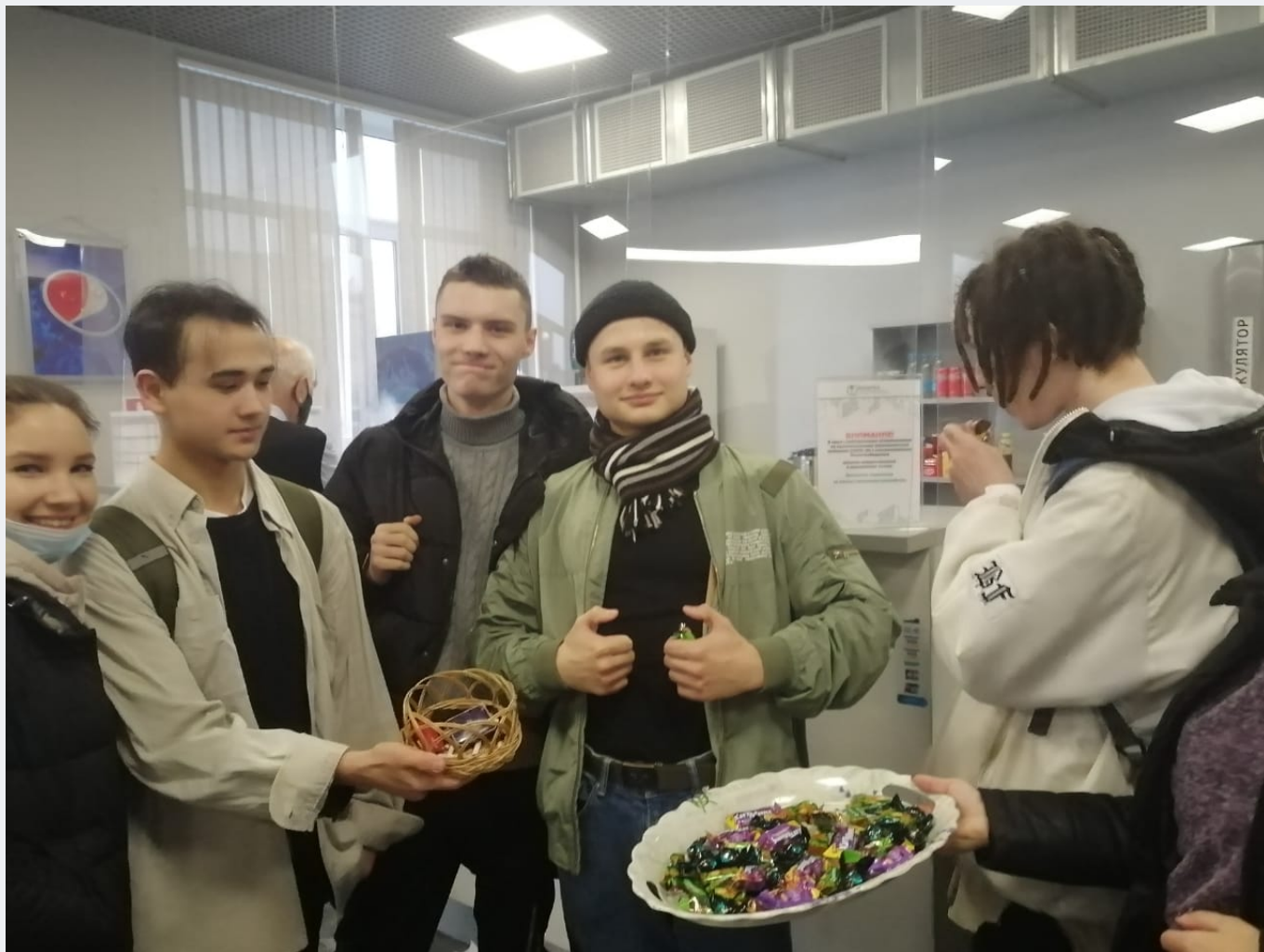
В группах проведены тематические классные часы, посвящённые охране здоровья и профилактике коронавирусной инфекции.